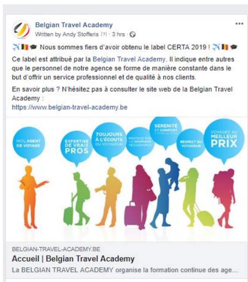
Exemple d'un message personnalisé pour votre page Fan

Conseil : ajoutez des émoticônes au sein du message (cela augmente le taux d'interaction avec votre audience).