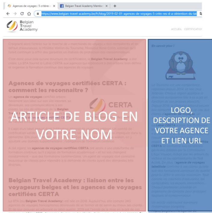
Disposition classique d'un article de blog sur le site web de la BTA

Ce service est gratuit pour votre agence.